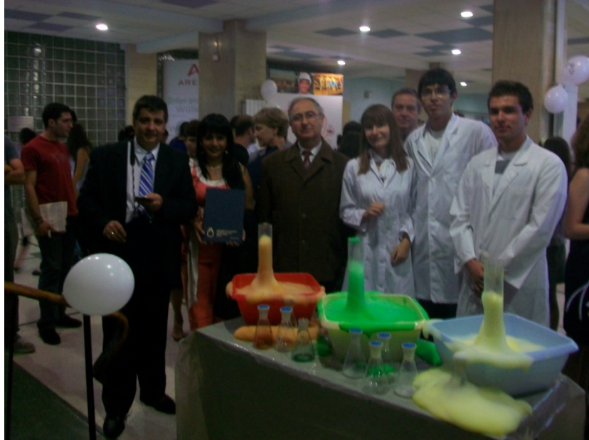
Fig.1 Parte de la delegación colombiana con estudiantes de la Universidad Técnica de Sofía

La “Noche Europea del Investigador” es un evento anual del programa Capacidades del Séptimo Programa Marco de la Comunidad Europea, que muestra, conjunto con los resultados de los proyectos de investigación, la otra cara de la vida de los científicos, como literatura, arte, música, la cultura en general. Es un macro-evento que permite a través de visitas guiadas, experimentos de laboratorios abiertos a todo el público y actividades científicas de toda índole, interactivas, participativas, talleres, explicar por qué es importante investigar temas como cambio climático, desastres naturales, energías renovables, producción limpia, responsabilidad social.