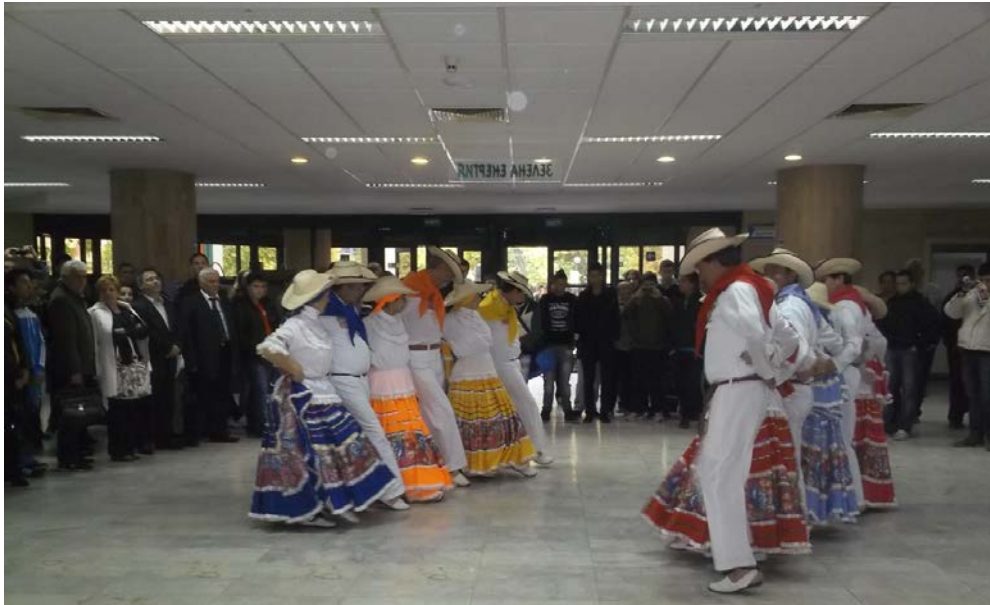
Fig. 2 Danzas colombianas en la Universidad Técnica de Plovdiv

La Feria Internacional de Plovdiv es el mayor foro búlgaro de bienes de inversión y tecnología, funciona ininterrumpidamente desde el año 1892 y desde el año 1936 es miembro de la UFI. En el año 2013 se presentaron 1040 exposiciones técnicas, de 41 países del mundo. En esa feria hay espacios para que las universidades puedan presentar sus resultados de los proyectos de investigación en 10 categorías: tratamiento de aguas, electrónica, bioquímica y biofísica, producción limpia, telecomunicaciones, transporte, entre otros. También existen otros espacios como foros, conferencias, ruedas de negocio, en donde los participantes puedan indagar sobre temas de innovación e investigación para la industria. Se entregan premios en distintas categorías, por ejemplo: creatividad para la introducción de un nuevo producto en el mercado, mejor diseño audio visual, entre otros.