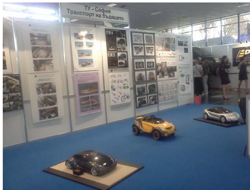
Fig. 3 Stand de la Universidad Técnica de Sofía en la Feria Internacional de Plovdiv

La Feria Internacional de Plovdiv es el mayor foro búlgaro de bienes de inversión y tecnología, funciona ininterrumpidamente desde el año 1892 y desde el año 1936 es miembro de la UFI. En el año 2013 se presentaron 1040 exposiciones técnicas, de 41 países del mundo. En esa feria hay espacios para que las universidades puedan presentar sus resultados de los proyectos de investigación en 10 categorías: tratamiento de aguas, electrónica, bioquímica y biofísica, producción limpia, telecomunicaciones, transporte, entre otros. También existen otros espacios como foros, conferencias, ruedas de negocio, en donde los participantes puedan indagar sobre temas de innovación e investigación para la industria. Se entregan premios en distintas categorías, por ejemplo: creatividad para la introducción de un nuevo producto en el mercado, mejor diseño audio visual, entre otros.