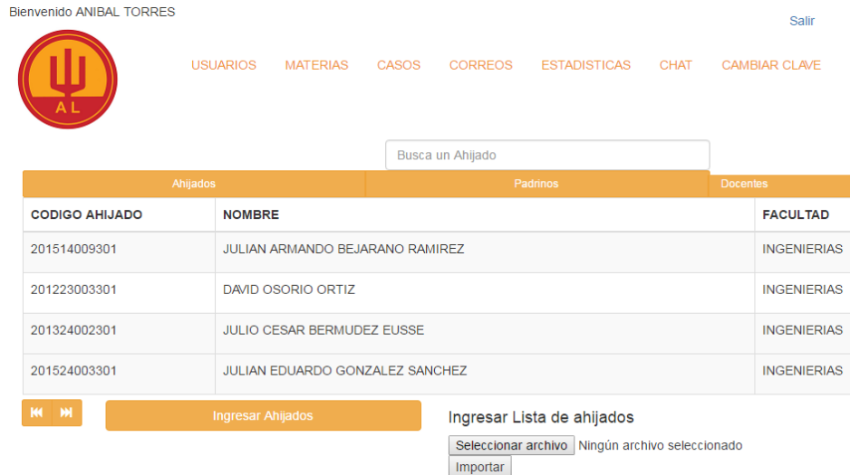
Aspecto de la interface de administración, del aplicativo del Plan Padrino.

En la segunda etapa, se implementó toda la fase de desarrollo, el diseño previo definió tres roles en el sistema por tanto se optó por un desarrollo modular para cada uno, lo que independizó la aplicación de posibles fallos o caídas de los otros dos componentes y una base de datos con un enfoque orientado a objetos.