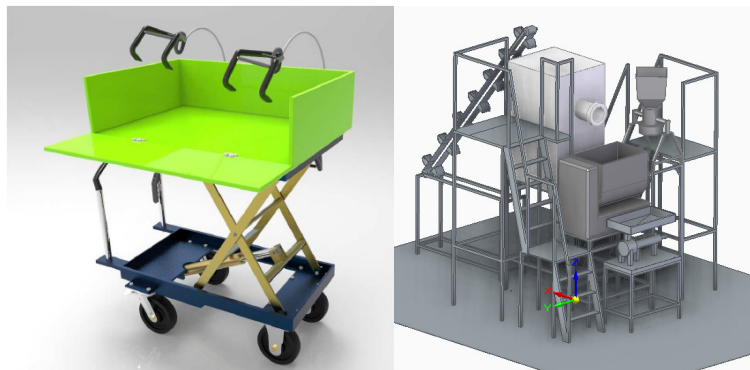
Figura 3. Soluciones divergentes para la misma necesidad inicial

Otro ejemplo interesante es el de los equipos 2 y 3 del semestre 201910 (Tabla 1). Los dos equipos buscaron disminuir el esfuerzo de los trabajadores asociado al transporte de materias primas dentro de la planta de producción. El equipo 2 definió su problema de manera que terminaron desarrollando una carretilla elevadora con módulos especiales para transportar materia prima. El equipo 3 propuso la integración de la maquinaria existente por medio de una configuración en cascada, de modo que se minimizara la necesidad de transportar las materias primas de forma manual entre los procesos (Figura 3)