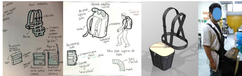
Figura 2. Solución al problema de las frutas dañadas durante su recolección. Incluye prototipo funcional.

Otro ejemplo interesante es el de los equipos 2 y 3 del semestre 201910 (Tabla 1). Los dos equipos buscaron disminuir el esfuerzo de los trabajadores asociado al transporte de materias primas dentro de la planta de producción. El equipo 2 definió su problema de manera que terminaron desarrollando una carretilla elevadora con módulos especiales para transportar materia prima. El equipo 3 propuso la integración de la maquinaria existente por medio de una configuración en cascada, de modo que se minimizara la necesidad de transportar las materias primas de forma manual entre los procesos (Figura 3)