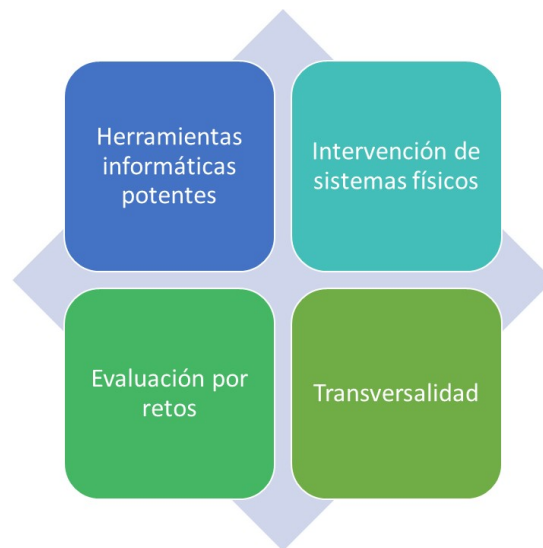
Figura 1. Elementos de la innovación de aprendizaje activo.

La figura 1 ilustra cómo se integraron estos elementos en el diseño e implementación de Introducción a la Ingeniería y las Ciencias Básicas en la IUPG.